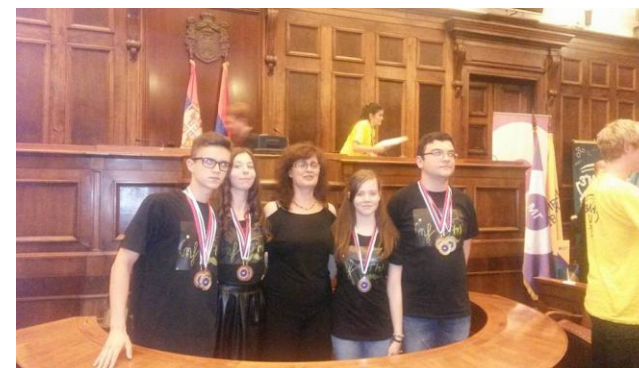
Imagine festivitatea de premiere Sala Parlamentul Serbiei